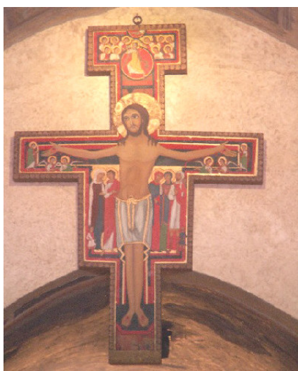
Kreuz von San Damiano