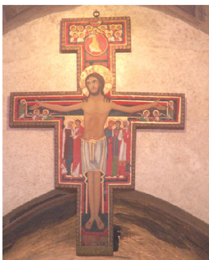
Kreuz von San Damiano